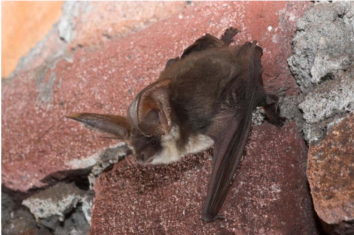
Grijze grootoor vleermuis.