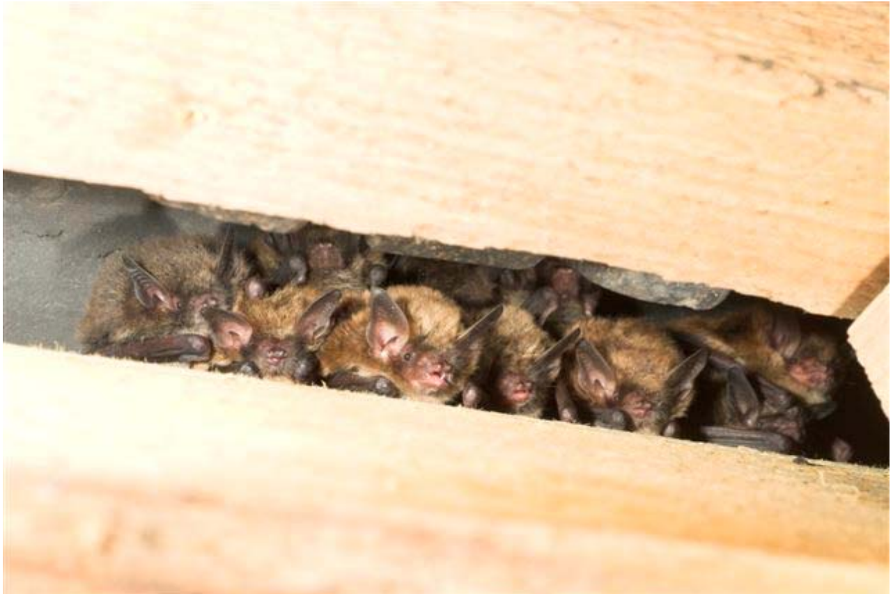
Kolonie Brandt's vleermuizen.

Het is soms behoorlijk moeilijk om grootte te schatten op grotere afstand. Desalniettemin maakt het nogal een verschil of je bij een dier de indruk hebt dat het een dier is met een laatvlieger- grootte of juist een dier met een grootte-indicatie van een dwergvleermuis. Als hulpmiddelen kan het helpen dat de meeste planken die gebruikt worden op kerkzolders 8 centimeter breed zijn. Een laatvlieger “past daar net tussen”. Een gewone dwergvleermuis is half zo groot.