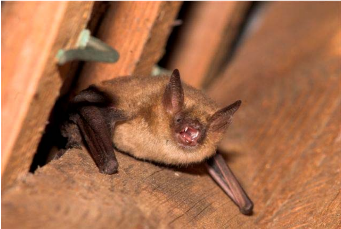
Ingekorven vleermuis.